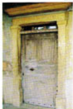
Une porte et son linteau à imposte.